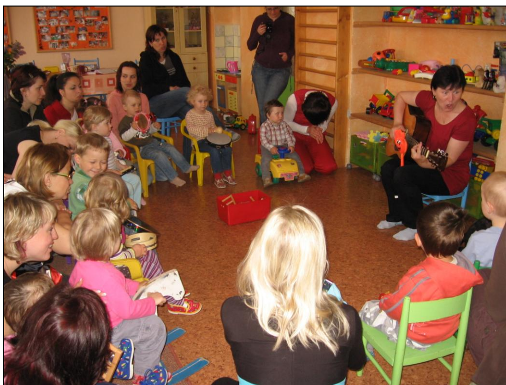
Den otevřených dveří v RC Pohoda Žamberk